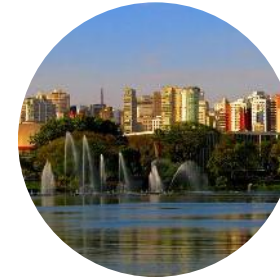
1º Parque Ibirapuera