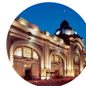
5º Mercado Municipal

Qual é o principal ponto turístico da cidade que você recomendaria a um visitante?