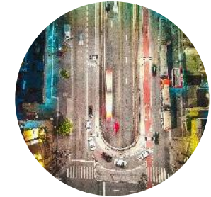
2º Av. Paulista