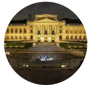
4º Museu do Ipiranga