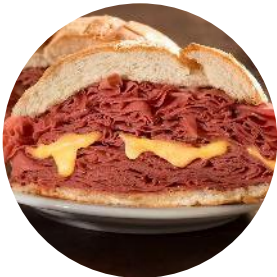
1º Sanduíche de Mortadela