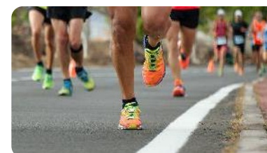
2º Corrida de rua