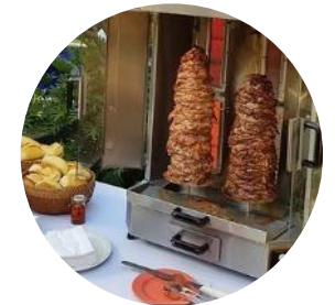
5º Churrasco Grego