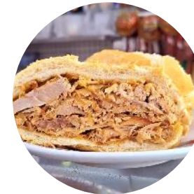
4º Sanduíche de Pernal